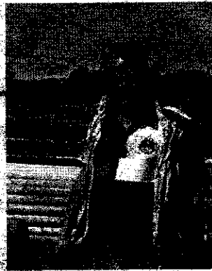
Flavien, le nouveau patron du Val Kalypso, devant les nouveaux obstacles de cross qui vont être installés.

« Le but, c'est de convenir à tous les goûts, précise Flavien. Si des cavaliers sont motivés